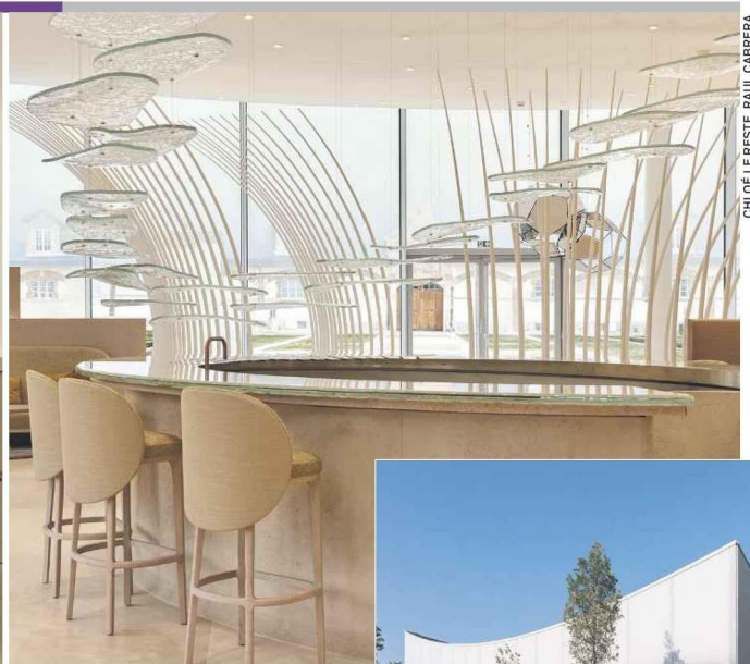
CHLOÉ LE RESTE RAUL CABRERA